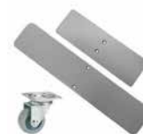
Platte voeten met of zonder wielen